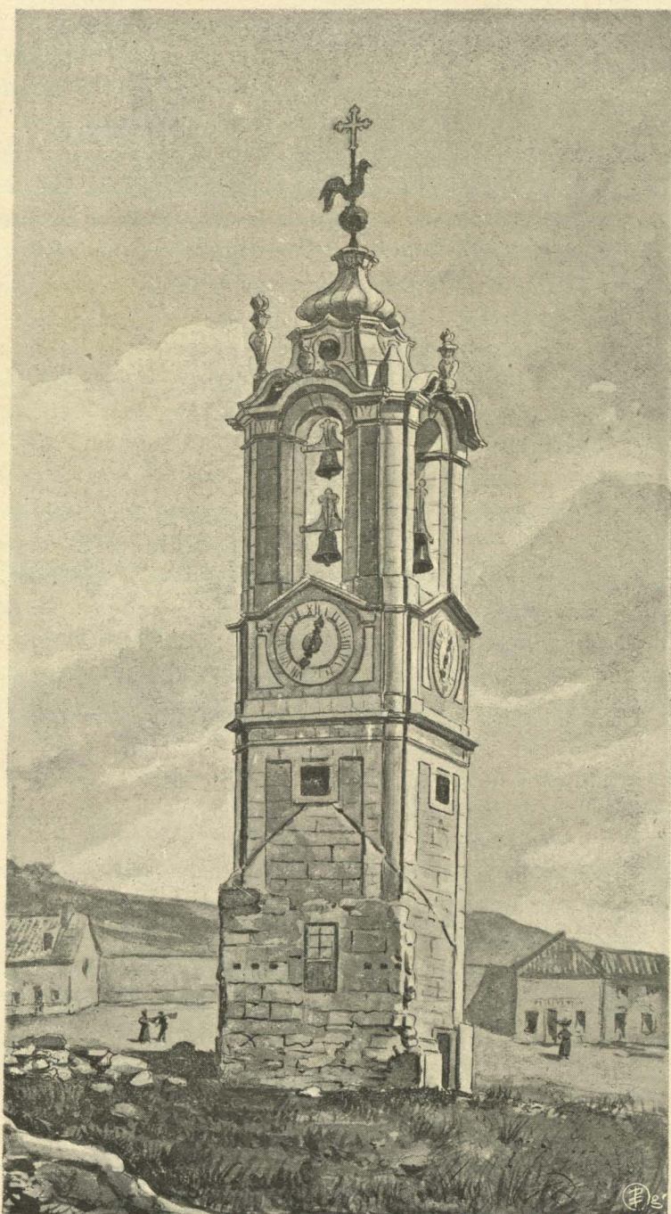
Torre da Patriarchal, na Ajuda