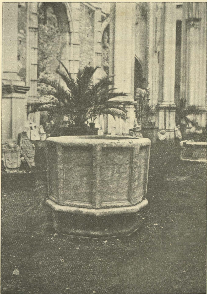
Pia baptismal da Igreja Patriarchal, da Ajuda. — Museu do Carmo , n.º 3826.

BOL. DE ARCHIT. E ARCHEOL., T. XI, N.º 9 — PAG. 633